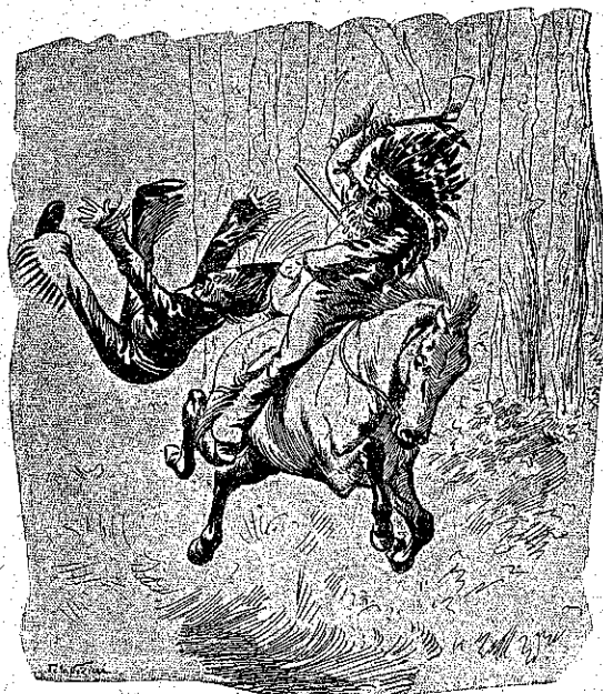
«Ετιμώρησε τον προδότην...» (Σελ. 387, στ. α.)

Χρυσωμένο-Χιόνι-πού-πετα, ειπεν ο Ίνδος, σου φέρνω τα κλεμμένα διαμαντικά. Τα είχε κλέψη εν άγνοία μου ένας ληστής, τον όποιον θα εσκότωνα εγώ ο ίδιος, αν δεν εύρισκα προ όλίγου το πτώμα του εις το δάσος, κοντά εις τον βάλτον! Ο Λαποδύτης, Χρυσωμένο-χιόνι-πού-πετα, ήτο ο Αύγουστος!