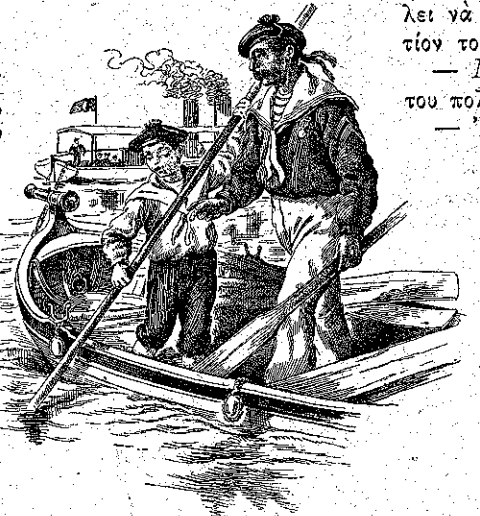
«Μὲ τί καμάρι ἐκρατοῦσα τὸν γάντζον...» (Σελ. 389.)

τῆς τὰ ἐμπέρδευσαν τόσον πολὺ, ὥστε ἡ μίς Ρεβέκκα, ἐντελῶς-παραχαλισμένη, συνεφώνησε μαζί των ὅτι ὁ κόμης τῆς Μαρκίας ἦτο «φρικτὸν ἔστι καὶ λέγειν!»