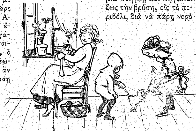
«Παίζουν με το ψιφινάκι...» (Σελ. 387, στ. γ')

Η Λουλούκα και ο Λουλουκος παίζουν με το ψιφινάκι. Και παίζουν τόσο φρόνιμα και ήσυχα, ώστε ή Σταματίνα άποφασίζει και τ' άφίνει μοναχά τους μια στιγμή, και πηγαίνει έως την βρύση, εις το περιβόλι, διά να πάρη νερό